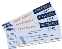
Chèques permis KADODRIVE