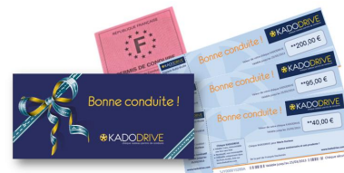
Chèques et pochette KADODRIVE